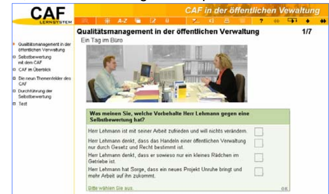
Screenshot aus dem CAF Lernsystem

Das CAF-Lernsystem dient als Wissensressource zum selbstgesteuerten Lernen. Vorrangige Lernziele sind das Wissen um die Bedeutung von Qualität sowie die Selbstbewertungsmethode CAF. Die Nutzer lernen die Inhalte und das Verfahren des CAF einführend kennen. Das CAF-Lernsystem ist interaktiv gestaltet. Integrierte Fragen sowie ein Abschlusstest bieten dem Lernenden die Möglichkeit, seinen Lernerfolg zu überprüfen.